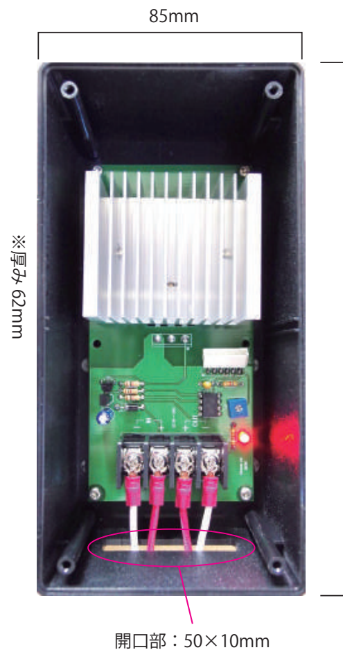
箱入り（納品状態・蓋付き）